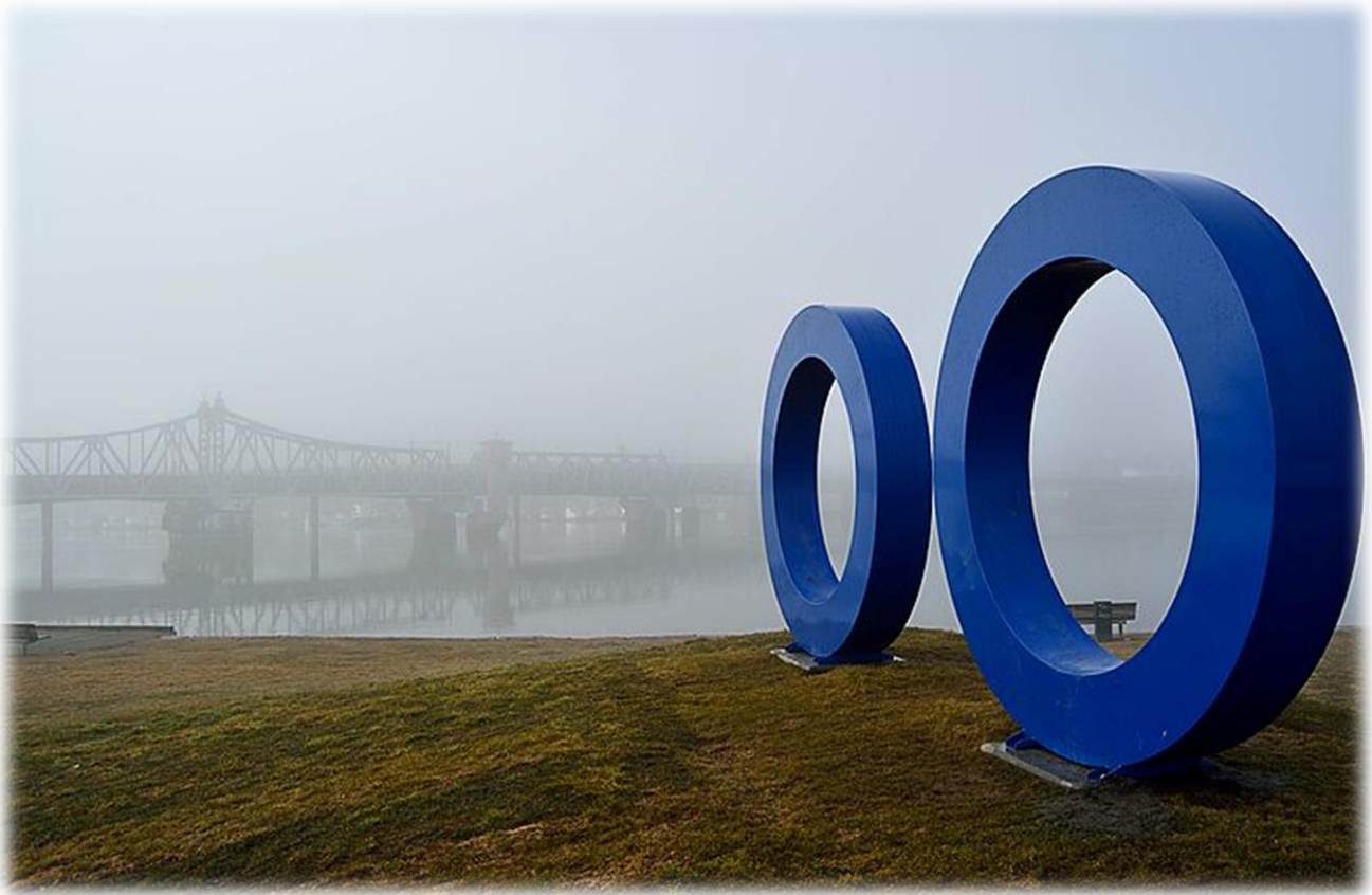
Holmenokken i Drammen

har ført til et fornyet fokus på kommunikasjon og særlig på hvordan strategisk kommunikasjon kan bygge opp om kommunenes omdømme. Omdømmeprojekter kan ha innflytelse på hvordan øvrig kommunal styring utspilles. Omdømmebygging kan blant annet sette et klart internt fokus på hva slags holdning arbeidstakere skal ha i forhold til befolkningen og hvordan det skal arbeides.