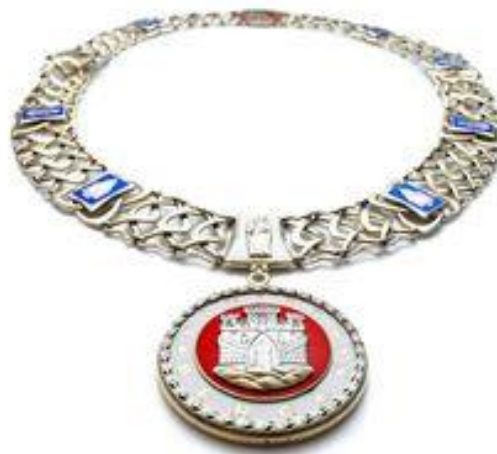
Ordførerkjede Bergen

En del av forskningsprosjektet har også sett på interkommunale samarbeidsløsninger i forhold til demokrati. Interkommunale samarbeid er gjerne sett på som kompensasjon for «småkommuneproblemer», og nye oppgaver til kommunene gjennom eksempelvis samhandlingsreformen gjør kommunesamarbeid mer aktuelt enn noensinne, gitt den eksisterende kommunestrukturen. Slikt samarbeid gir mange fordeler, særlig hvis man regionalt klarer å stå sammen for å skape utvikling. Forskningsprosjektet viser imidlertid at det er utfordrende å forene bred politisk deltakelse gjennom innbyggerinvolvering med effektive interkommunale samarbeidsløsninger.