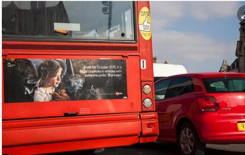
☛ Diesel cars tested in Norway produced quadruple the NOx emissions of large buses and lorries in city driving conditions.

Failure to use available technology to cut dangerous nitrogen oxides in new cars is a 'disgrace', says MEP