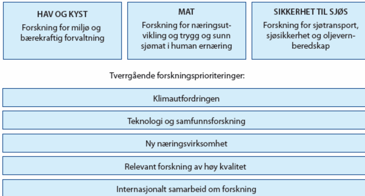
Figur 1 Skjematisk oversikt over Fiskeri- og kystdepartementets ansvarsområder og forskningsprioriteringer