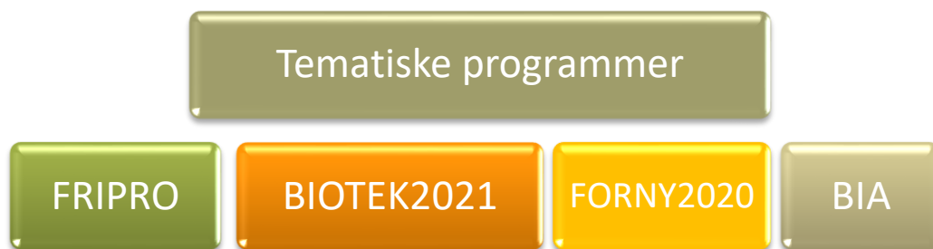
Figur 1: BIOTEK2021 sin plassering er mellom de frie arenaene FRIPRO og BIA/FORNY2020.