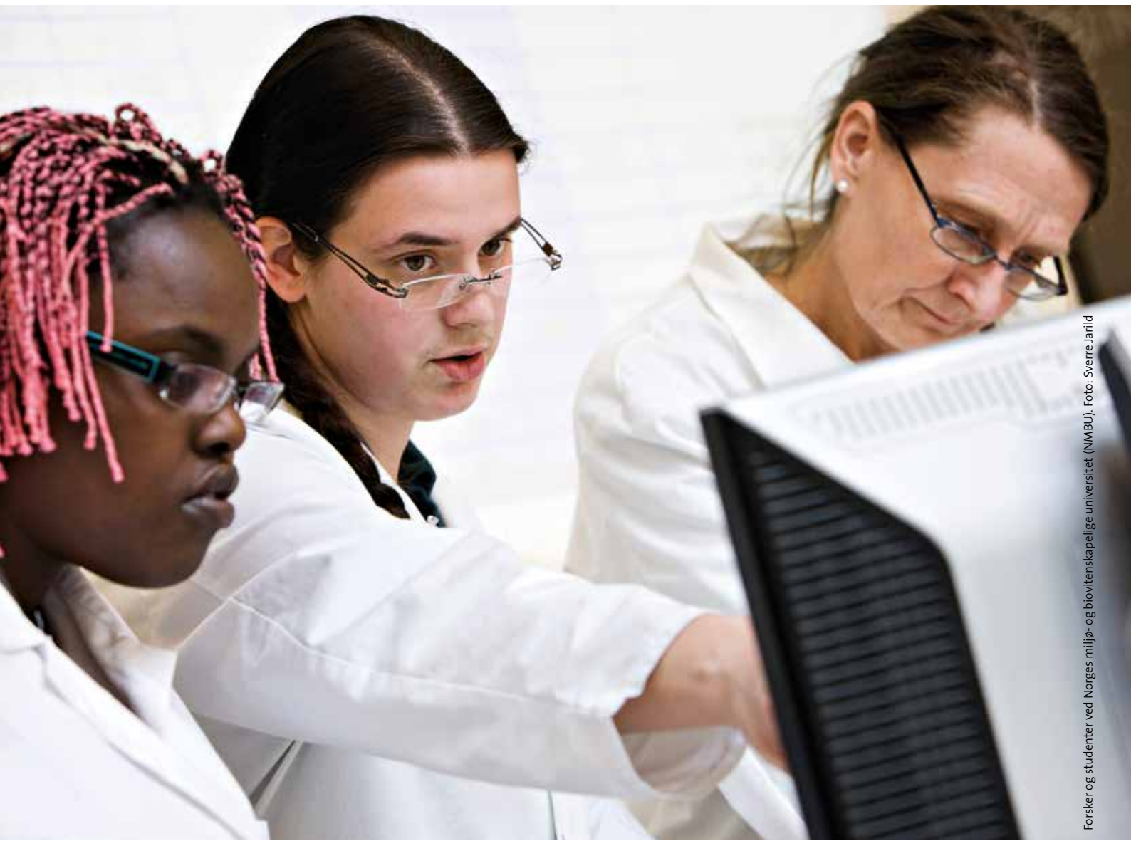
Forsker og studenter ved Norges miljø- og biovitenskapelige universitet (NMBU).