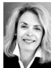
Professor Londa Schiebinger, Stanford University, USA. Schiebinger leder prosjektet «Gendered Innovations» ved Stanford. genderedinnovations.stanford.edu

Gendered Innovations tilbyr forskere og ingeniører avanserte metoder for analyse av kjønn. Å integrere disse metodene i grunnforskning og anvendt forskning gir fremragende resultater innenfor vitenskap, helse og medisin, teknologisk forskning, politikk og praksis.»