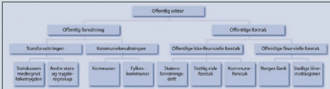
Figur 8.2 Skematisk illustrasjon av offentlig sektor

Offentlig sektor kan skematisk fremstilles som vist i figur 8.2.