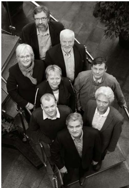
Norges forskningsråds hovedstyre 2007- 2010.